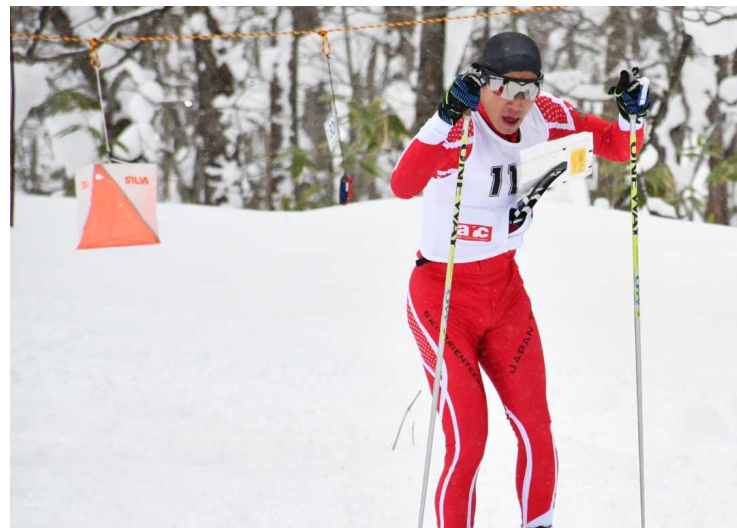
スキーオリエンテーリング