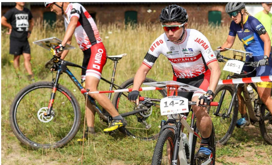
バイクオリエンテーリング