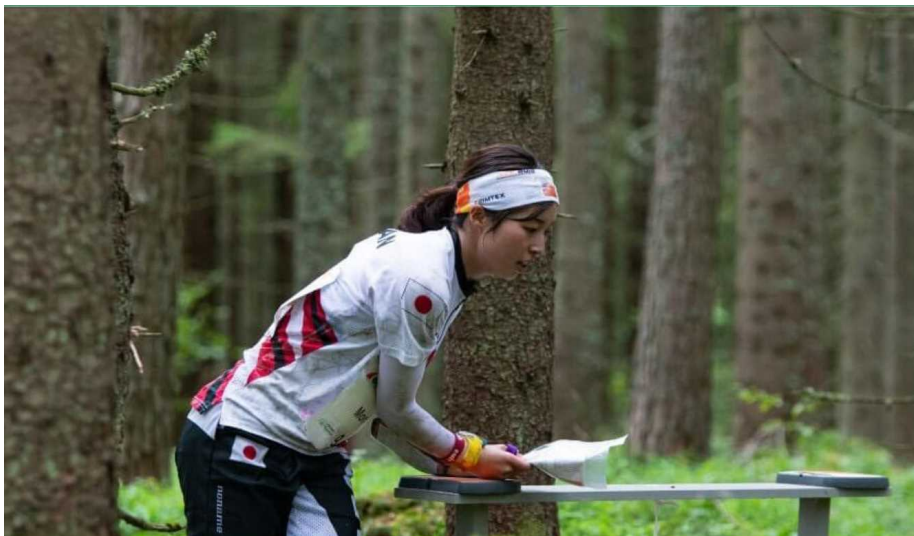
フットオリエンテーリング