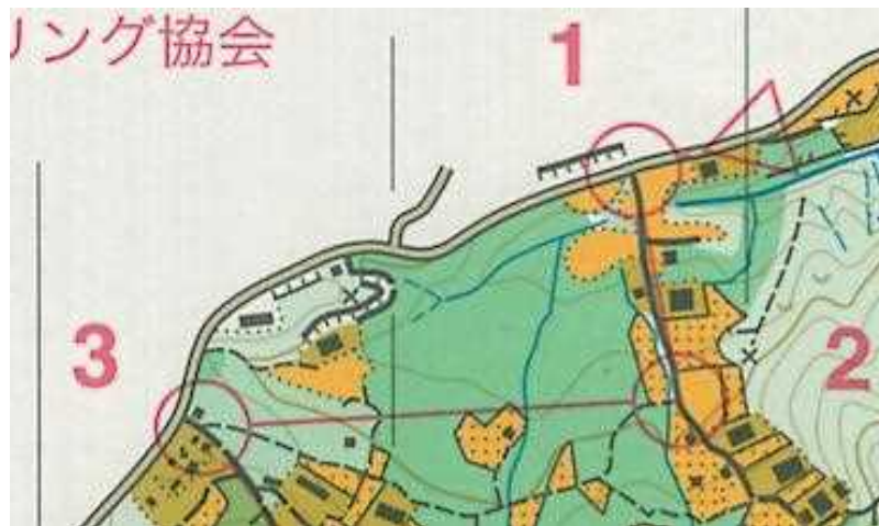
オリエンテーリング競技地図